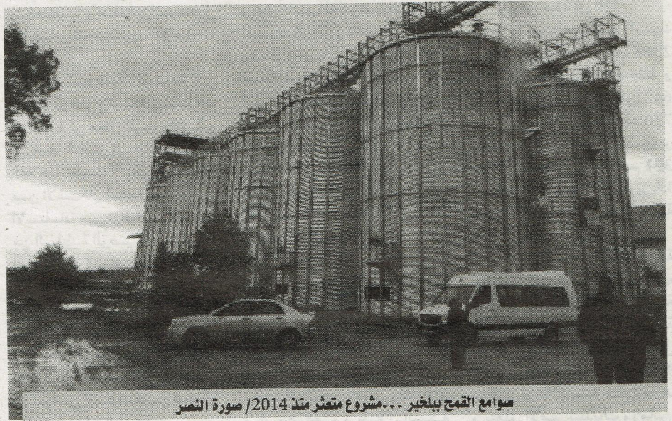
صوامع القمح ببلخير... مشروع متعثر منذ 2014

و تفقد الوزير عدة مزارع عمومية و خاصة و استثمارات قيد النشاط و حث المزارعين على بذل المزيد من الجهد لتحقيق الاكتفاء المحلي من المنتجات الاستراتيجية و المساهمة في الجهد الوطني الرامي إلى الحد من عمليات الاستيراد المكلفة. فريدغ