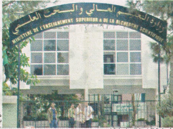
مبنى وزارة التعليم العالي والبحث العلمي

وتخص الاتفاقية الثانية إرساء تعاون وثيق في مجال البحث العلمي والتكنولوجي؛ من خلال وضع برنامج عمل قطاعي مشترك لمجابهة جائحة كورونا يدعم مخابر البحث الجامعية للكشف والتشخيص باستخدام تقنية "آر تي بي سي آر"، بعد تأهيلها من قبل معهد باستور، وهي الاتفاقيات التي قال بخصوصها الوزير بن زيان إنها تدخل في إطار برنامج الإصلاح في فرع الطب الذي بدأت الوزارة الوصية في تطبيقه منذ ثلاث سنوات، ويشمل محتويات ومضامين برامج التكوين، ولاسيما تعزيز القيام بإجراء التريصات الميدانية التطبيقية على مستوى كل الهياكل الصحية والاستشفائية.