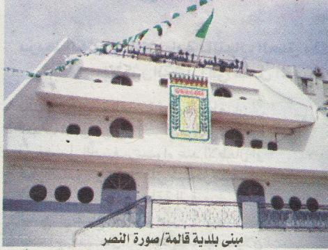
مبنى بلدية قالمة

أمر القضاء، بوضع رئيس بلدية قالمة الحالي و رئيس البلدية السابق، رهن الحبس المؤقت، فيما تم وضع 15 شخصا آخر تحت التزامات الرقابة القضائية. للاشتباه بضلوعهم في قضايا فساد تتعلق بالصفقات العمومية. و قد مثل أكثر من 20 شخصا بينهم رئيسا البلدية الحالي و السابق و موظفون و أطراف أخرى أمام قضاة التحقيق بمحكمة بوشقوف خلال الساعات الماضية، بعد انتهاء التحقيقات الأمنية الخاصة بشبهات تتعلق بسوء استغلال الوظيفة و منح امتيازات غير مبررة.