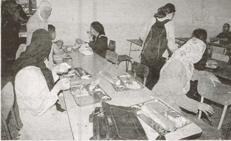
لا يكاد يمر يوم دون أن تنتشر صور عن الإطعام والمأوى وسوء الخدمات

طالب الديوان الوطني للخدمات الجامعية مديري الخدمات عبر الوطن بمنح الديوان تفسيرات عن كل ما ينشر حول الأحياء الجامعية التابعة لمقاطعاتهم، خاصة منها التي تثير ضجة وتصل إلى مواقع التواصل الاجتماعي مؤرخة بصور وفيديوهات، بالإضافة إلى مطالبته بإيداع ردهم على المراسلات التي يطلبها الديوان حول توضيحات عن أحداث رصدها المتابعون للشأن الطلابي عبر هذا الأخير.