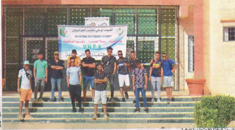
جانب من الوقفة الاحتجاجية للطلبة

وختم بيان الطلبة بيانه بما وصفه "الظلم الذي يتعرضون له، عن طريق استغلال قرار الوزارة المتمثل في عدم القيام بمعاينة أوراق الامتحان، وانعدام التصحيحات النموذجية للامتحانات، وتماطل بعض الأساتذة في إعلان النتائج، إضافة إلى عدم احترام البروتوكول الصحي، وعدم احترام التنظيمات الطلابية وغياب سياسة التشاور رغم أنها شريك اجتماعي في الجامعة". وهدد أصحاب البيان بالدخول في حركة احتجاجية مفتوحة على مستوى الكلية إذا ما استدعى الأمر ذلك.