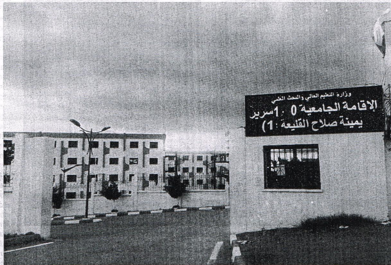
Les cités universitaires connaîtront un nouveau dispositif de sécurité

Tous ont apporté leur contribution en vue de l'élaboration dudit plan dans le cadre d'une journée d'étude, organisée récemment par la tutelle à l'Université de la formation continue (UFC) à Dély Ibrahim (Alger). Parmi les recommandations retenues pour être traduites sur le terrain, il est question de l'installation de caméras de surveillance, du port de l'uniforme et du badge pour les agents de surveillance, entre autres. «Le ministère de l'Enseignement supérieur et de la Recherche scientifique œuvre pour faire face à toute situation pouvant porter atteinte à la sécurité et la sérénité de la famille universitaire... et ce, avec la collaboration des autorités concernées, et en réactivant les plans de sécurité interne dans les institutions universitaires, la généralisation de l'utilisation des systèmes de com-