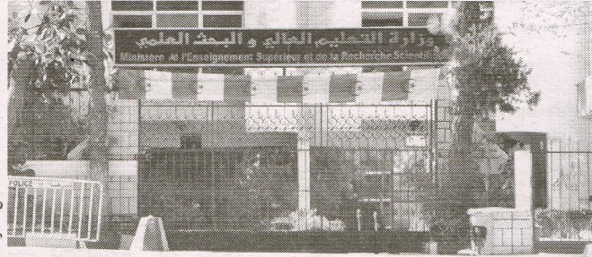
من حمزة كافي

● أوامر بعدم تأخير دفع المنح والتنظيمات تشدد على الطلبة الإبلاغ بأي تأخير