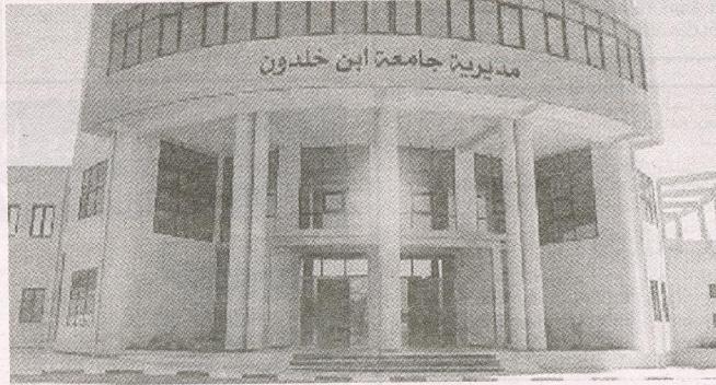
A l'occasion de la Journée de l'artiste, l'université de Taret a organisé un colloque