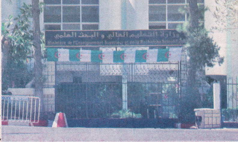
مبنى وزارة التعليم العالي والبحث العلمي

● طالب عدد واسع من الباحثين وزارة التعليم العالي والبحث العلمي بإعادة فتح المنصة الرقمية المخصصة لإيداع مشاريع البحث التكويني الجامعي، بعد غلقها تزامنا مع نهاية المهلة المحددة. ويرر المعنيون طلبهم بأن الأسابيع الماضية تزامنت مع امتحانات البكالوريا، حيث "حال ضعف تدفق الأنترنترنت دون فتح المنصة"، ناهيك عن تزامن الفترة مع امتحانات السداسي الثاني الذي أخذ جزءا كبيرا من وقت الأساتذة الباحثين.