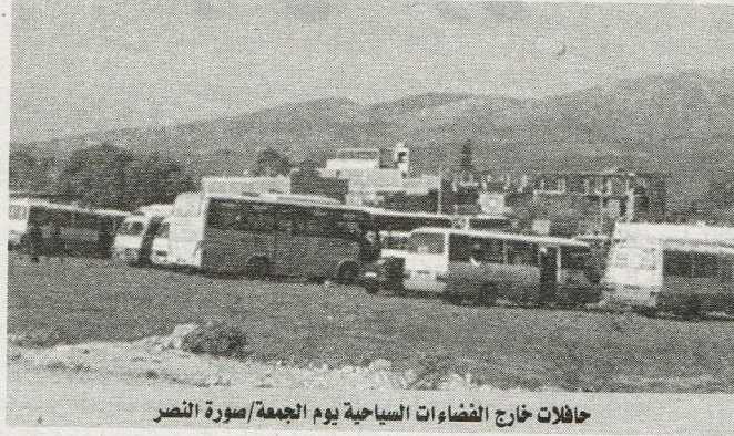
حافلات خارج الفضاءات السياحية يوم الجمعة

من المركبات التي تتحرك ببطء ثم تستسلم للأمر الواقع. ولم يتوقف سكان المدينة السياحية عن المطالبة ببناء محولات و منشآت فنية متطورة تنظم حركة السياح و تستوعب الضغط المروري الهائل، وخاصة حول الشلال و على طريق المركب الحموي و حول محمية العرائس.