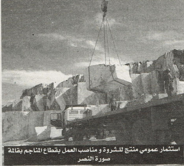
استثمار عمومي منتج للثروة و مناصب العمل بقطاع المناجم بقالة صورة النصر

استرجاع أكثر من 12 هكتارا من العقار الصناعي و يتوقع استرجاع المزيد من القطع الأرضية من المستثمرين غير القادرين على إطلاق مشاريعهم و الوفاء بالوعد التي قدموها عندما حصلوا على مساحات هامة من الأراضي بأسعار متدنية.