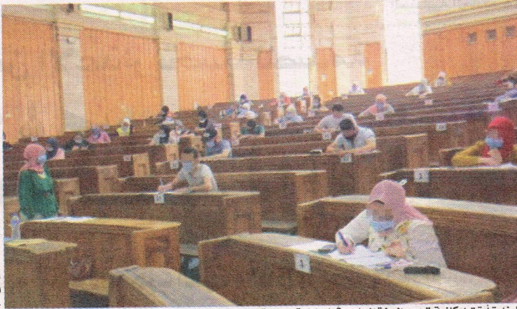
الوزارة أبقت إمكانية تمديد السنة الجامعية إلى نهاية جويلية بالنسبة للجامعات التي عرفت تأخرا بيذاغوجيا

• جامعة الجزائر 3 بمختلف كلياتها ومعهد الرياضة البدنية انطلقت بها دورة الامتحانات العادية للسداسي الثاني، وكلية علوم الإعلام والاتصال دشنتها أمس السبت، على أن تنتهي بالنسبة للسنة الأولى في 17 جوان، فيما تتفاوت التواريخ لباقي السنوات. من جهته، معهد الرياضة تتطلق به الامتحانات يوم 5 جوان، وبعض الجامعات بشرق وغرب البلاد انطلقت بها هذه الامتحانات، والمتبقي منها سينطلق في الأسبوع المقبل، على غرار جامعة البليدة التي وضعت رزنامة امتحانات بداية من الأسبوع المقبل.